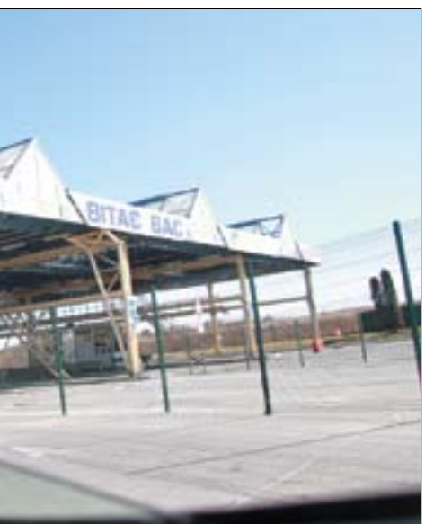
Товары, изготовленные с согласия правообладателя, но ввезенные в нашу страну параллельными импортерами, являются оригинальными, а не контрафактными

На то же направлены положения TRIPS (статьи 46, 61) и Соглашения об ассоциации Украины с ЕС (статья 237), предусматривающие необходимость конфискации и уничтожения контрафакта, оборудования и материалов для его изготовления. Кроме того, частью 4 статьи 6 Закона Украины «О защите прав потребителей» запрещается введение в оборот фальсифицированной продукции, то есть продукции, изготовленной с нарушением технологии, или с непра-