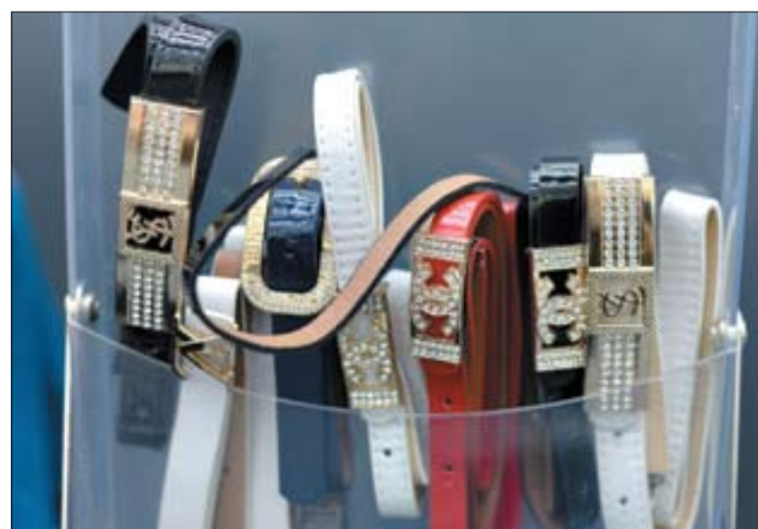
Поддельные товары неизвестного происхождения и качества не должны попадать в свободное обращение на рынок Украины, а поэтому подлежат уничтожению

Отдельно следует вспомнить, приостановление таможенного оформления небольших партий товаров, которые перемещаются (пересылаются) через таможенную границу Украины в международных почтовых и экспресс-отправлениях. Учитывая, что пока нет нового Таможенного реестра, в котором в новом виде заявки на внесение в реестр найдет отражение согласие правообладателя на приостановление таможенного оформления и уничтожение небольших партий товаров по статье 401 1 ТК Украины, сообщений о приостановлениях по этой статье наша компания не получала. Однако за это время таможни осуществили 28 приостановлений таможенного оформления почтовых